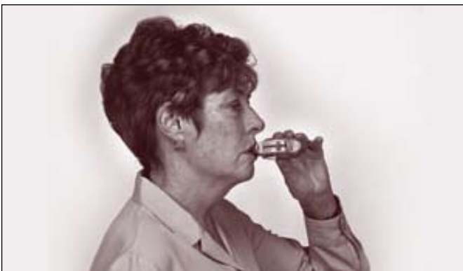
Femme utilisant un inhalateur à poudre sèche.